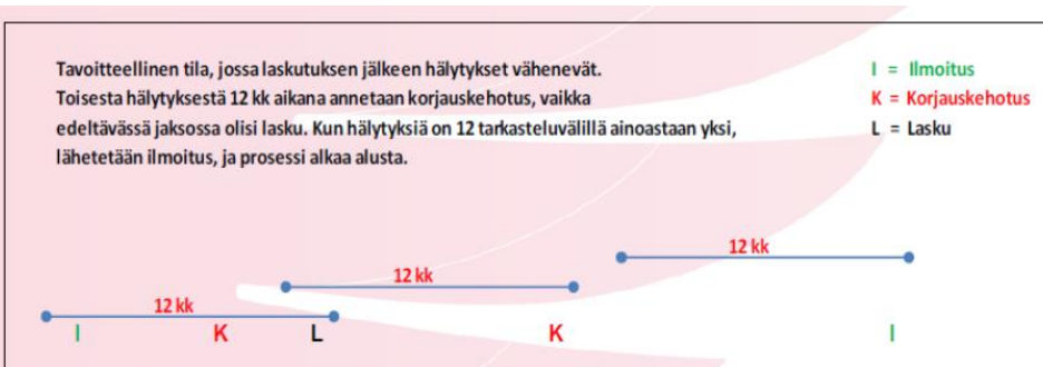
Kuva 2 c: Tavoitteellinen tila, jossa laskutus johtaa erheellisten paloilmoitusten vähenemiseen