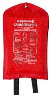
Kuva 7: Sammutuspeite

Sammutuspeite sopii pienten palonalkujen ja ihmisten päällä olevien vaatteiden sammuttamiseen tukahduttamalla. Suositeltava koko on vähintään 180 x 120 cm.