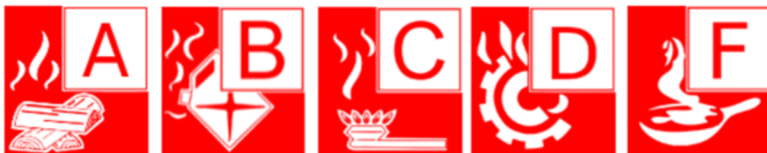
Kuva 1: Käsisammuttimien teholuokat kertovat, minkä tyyppisiä paloja sammuttimella voi sammuttaa.