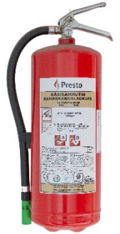
Kuva 4: Nestesammutin

Nestesammuttimen etuna on jauhesammutinta kevyempi jälkisiivous. Nestesammuttimen pakkasenkestävyys ja sähköturvallisuus tulee tarkastaa sammuttimen käyttöohjeesta. Nestesammutin ei sovellu ainoaksi sammuttimeksi tiloihin, joissa varastoidaan tai käsitellään palavia kaasuja.