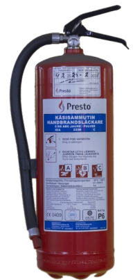
Kuva 3: Jauhesammutin

Jauhesammutin on hyvä yleissammutin lähes kaikkiin paloihin. Huonona puolena voidaan pitää sammutusaineen likaavuutta; hienojakoinen pöly voi aiheuttaa esim. sähkölaitteille suurta vahinkoa. Likaavuuden vuoksi jauhesammutinta ei suositella tiloihin, joihin voi kohdistua ilkivaltaa.