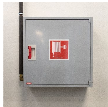
Kuva 2: Pikapaloposti

Pikapalopostit kuuluvat sekä rakennukseen kiinteästi asennettaviin sammutuslaitteisiin että alkusammutuskalustoon. Veden sammutusvaikutus on pääasiassa jäähdyttävä, mutta vesihöyry myös tukahduttaa paloa tehokkaasti. Vesi ei sovellu rasvapaloihin tai palavien nesteiden sammuttamiseen. Vesi myös johtaa sähköä, joten jännitteelliset kohteet on tehtävä virrattomiksi ennen vedellä sammuttamista.