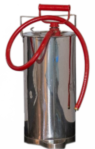
Kuva 6: Sankoruisku

F-luokan sammuttimet on suunniteltu estämään rasvan uudelleen syttyminen. Sammutusvaikutus perustuu palokaasujen eristämiseen sekä tukahduttamiseen. F-luokan sammuttimella on aina myös A- ja/tai B-luokitus. Mikäli F-luokan sammutin on ammattikeittiön ainoa sammutin, on huomioitava riittävä teholuokka myös A- ja/tai B-luokituksessa. Elintarvikepalosammuttimet sopivat keittiötiloihin.