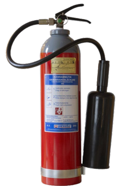
Kuva 5: Hiilidioksidisammutin

Hiilidioksidin sammutusvaikutus perustuu sekä tukahduttamiseen että jäähdyttämiseen. Hiilidioksidisammutin sopii huonosti käytettäväksi ulkoilmassa. Hiilidioksidisammuttimella on turvallista sammuttaa jännitteisiäkin kohteita ja siksi se sopii hyvin mm. atk-, tele- ja sähkötiloihin.