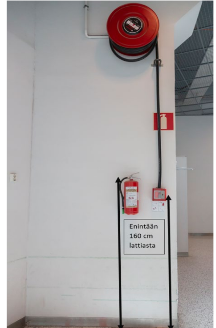
Kuva 9: Sammuttimen kahvan ja pikapalopostin letkun pään sijoitus lattiapinnasta

Myös pikapalopostin sijoituskorkeudessa on huomioitava, että letkun saa helposti lattiatasosta käyttöön. Pikapalopostikaappi sijoitetaan siten, että kaapin alareuna on enintään 120 cm korkeudella lattiapinnasta. Ylemmäs sijoitettavan pikapalopostikelan alas laskeutuvan letkun pää tulee sijoittaa enintään 160 cm korkeudelle lattiapinnasta.