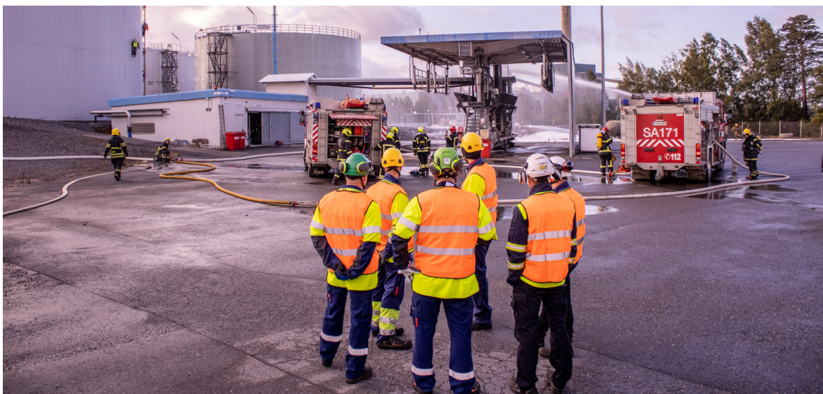
Kuva suuronnettomuusharjoituksista vuodelta 2019

Satakunnan maakunnan alueen asukkailla tulee olla asianmukaista tietoa alueellamme olevista kemikaalitoiminnanharjoittajista ja mahdollisuus varautua niihin onnettomuusvaikutuksiin, jotka saattavat ulottua toiminnanharjoittajan alueen ulkopuolelle. Turvallisuustiedote on laadittu yhteistyössä Satakunnan pelastuslaitoksen kanssa. Kehotamme perehtymään Turvallisuustiedotteen sisältöön. Tiedotteesta selviää, sijaitseeko koti tai työpaikka mahdollisten onnettomuusvaikutusten piirissä ja miten tulee toimia mahdollisessa suuronnettomuustilanteessa.