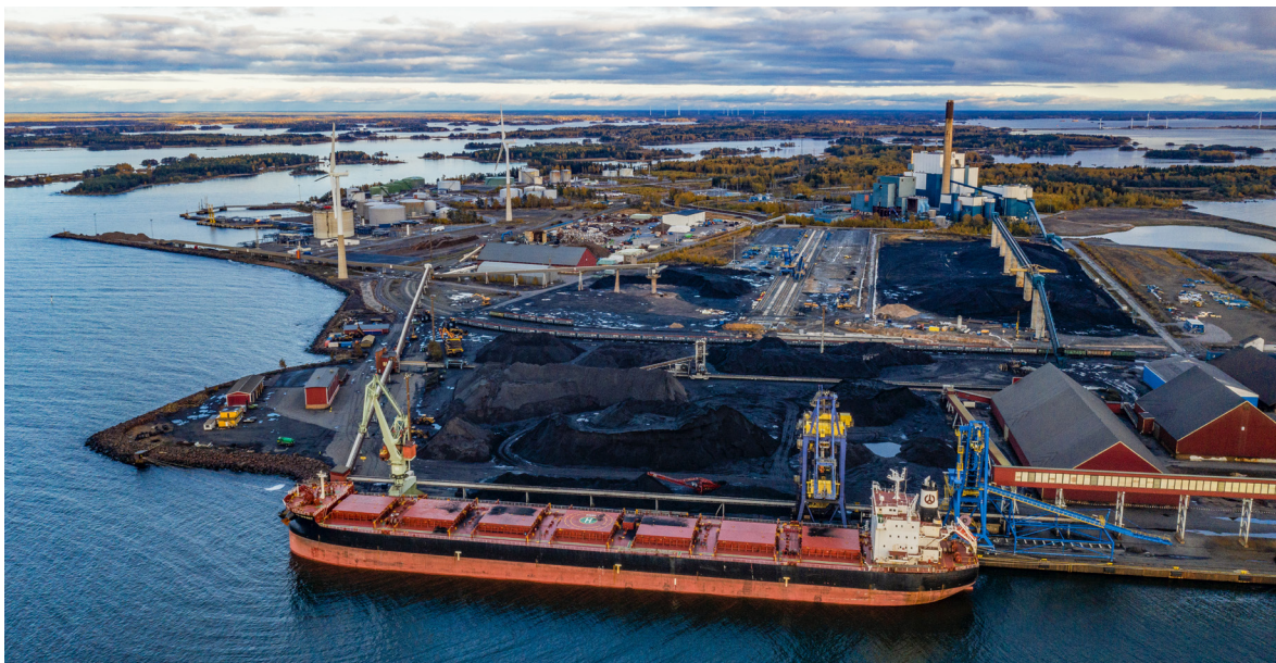
Kuva: Tahkoluoto, syksy 2019.