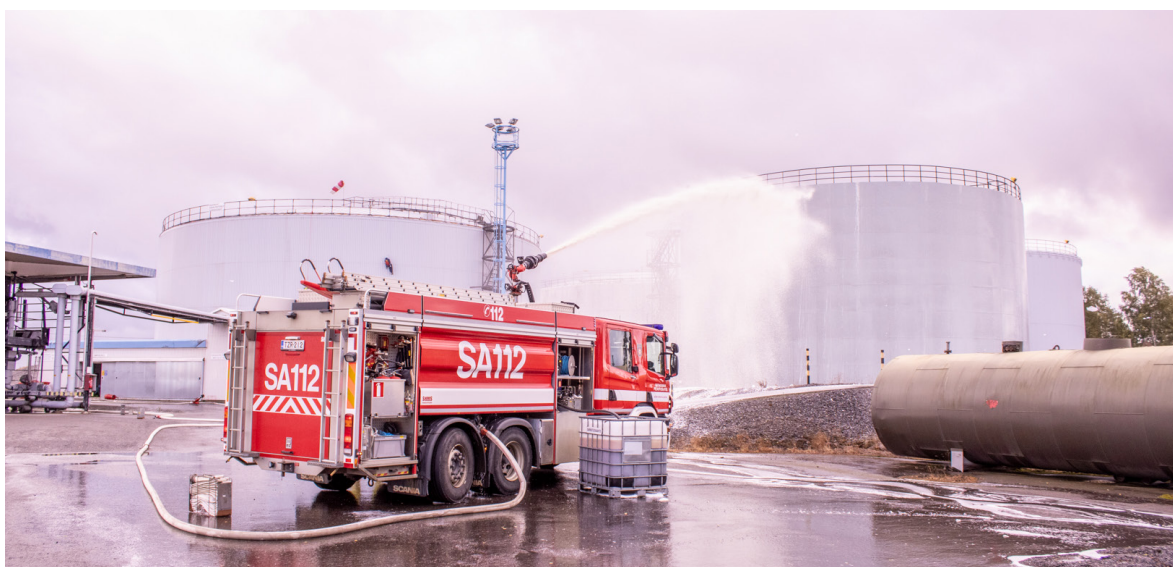
Kuva suuronnettomuusharjoituksista vuodelta 2019