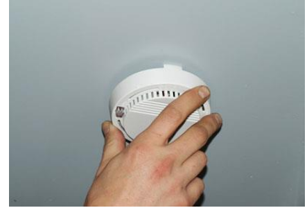
Kuva 2: Havainnekuva palovaroittimesta