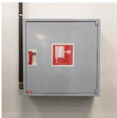
Kuva 2. Pikapaloposti

Pikapalopostit kuuluvat sekä rakennukseen kiinteästi asennettaviin sammutuslaitteisiin että alkusammutuskalustoon (Kuva 2). Veden sammutusvaikutus on pääasiassa jäädyttävä, mutta vesihöyry myös tukahduttaa paloa tehokkaasti. Vesi ei sovellu rasvapaloihin tai palavien nesteiden sammuttamiseen. Vesi myös johtaa sähköä, joten jännitteelliset kohteet on tehtävä virrattomiksi ennen vedellä sammuttamista.