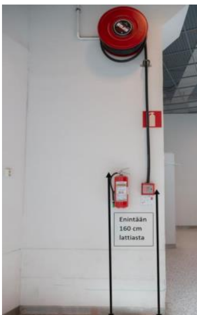
Kuva 9. Sammuttimen kahvan ja pikapalopostin letkun pään sijoitus lattiapinnasta.

Myös pikapalopostin sijoituskorkeudessa on huomioitava, että letkun saa helposti lattiatasosta käyttöön. Pikapalopostikaappi sijoitetaan siten, että kaapin alareuna on enintään 120 cm korkeudella lattiapinnasta. Ylemmäs sijoitettavan pikapalopostikelan alas laskeutuvan letkun pää tulee sijoittaa enintään 160 cm korkeudelle lattiapinnasta.