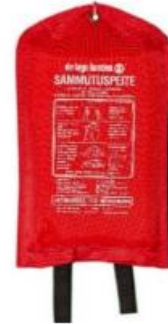
Kuva 7. Sammutuspeite