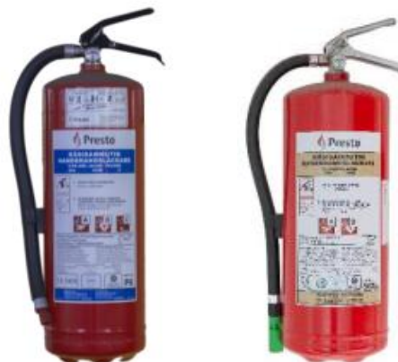
Kuva 3. Jauhesammutin Kuva 4. Nestesammutin