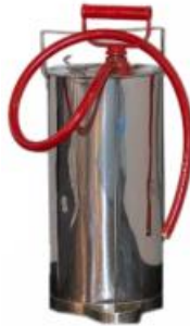
Kuva 6. Sankoruisku