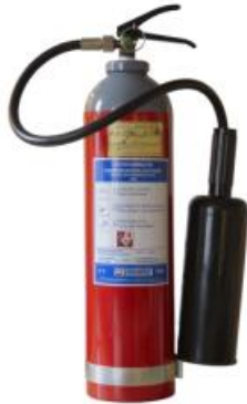
Kuva 5. Hiilidioksidisammutin