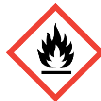
Kuva 1: Syttyvää -merkki

Muita syttyviä kaasuja kuin edellä mainitut, ei saa säilyttää autosuojassa!