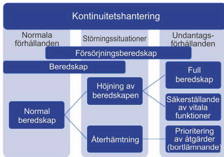
BILD 1. Ramverk för beredskap och kontinuitetshantering (Halen, Västra Nylands räddningsverk)

undantagsförhållanden höjer vi vår beredskap och förbereder oss på att trygga våra vitala funktioner och på att prioritera vår verksamhet (bild 1).