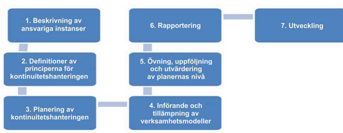
BILD 2. Faser under i räddningsverkets process för beredskapsplanering.

Räddningsverkets beredskapsplanering och kontinuitetshantering genomförs som en kontinuerlig process (bild 2). Detta kräver att man utser ansvariga personer, utarbetar definitioner samt planerar och rapporterar verksamheten. Övningar och utbildningar är också en del av denna process. Nya verksamhetsmodeller måste också kunna tillämpas i praktiken och verksamheten utvecklas.