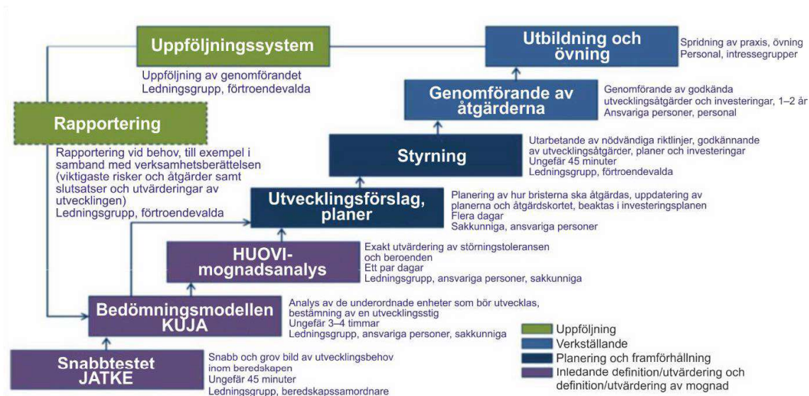
BILD 3. System för kontinuitetshandling (Källa: Kommunförbundet )