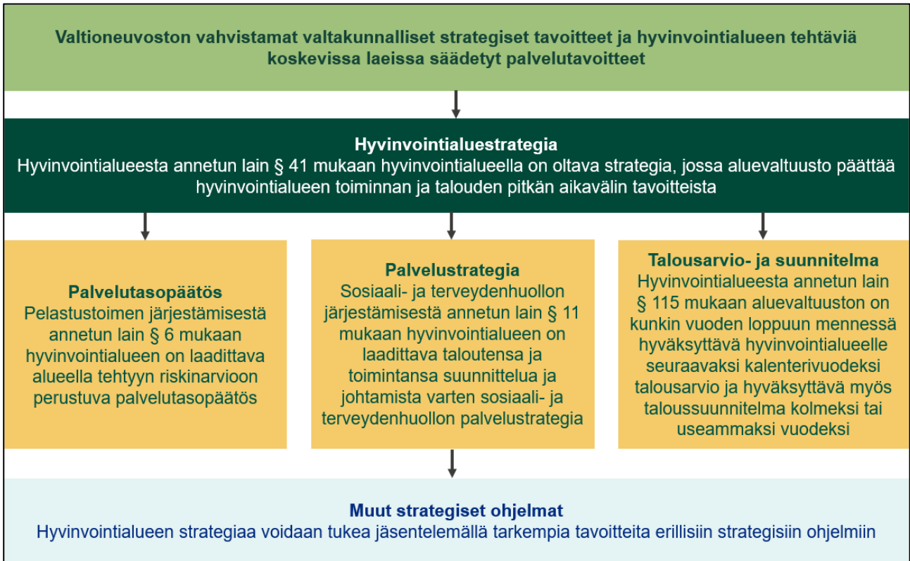
Kuva 1. Palvelutasopäätöksen suhde hyvinvointialueen strategiaan ja valtakunnallisiin strategisiin tavoitteisiin.

Kanta-Hämeen hyvinvointialueen pelastustoimen strategisten päämäärien perustana toimii pelastustoimen järjestämiselle asetetut valtakunnalliset strategiset tavoitteet sekä Kanta-Hämeen hyvinvointialueen strategia ja sen painopistealueet. Nämä yhdessä tulee ottaa huomioon pelastustoimen toiminnan painopisteitä ja strategisia päämääriä määritettäessä.