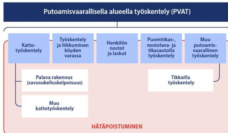
Kuva 4. keskeisten käsitteiden suhteet putoamisvaarallisella alueella työskentelyssä.

Putoamisvaarallisella alueella työskentely voi olla henkisesti ja fyysisesti vaativaa työtä, jonka turvallinen suorittaminen asettaa tekijälle terveydentilaan, toimintakykyyn, koulutukseen ja harjoitteluun liittyviä erityisvaatimuksia.