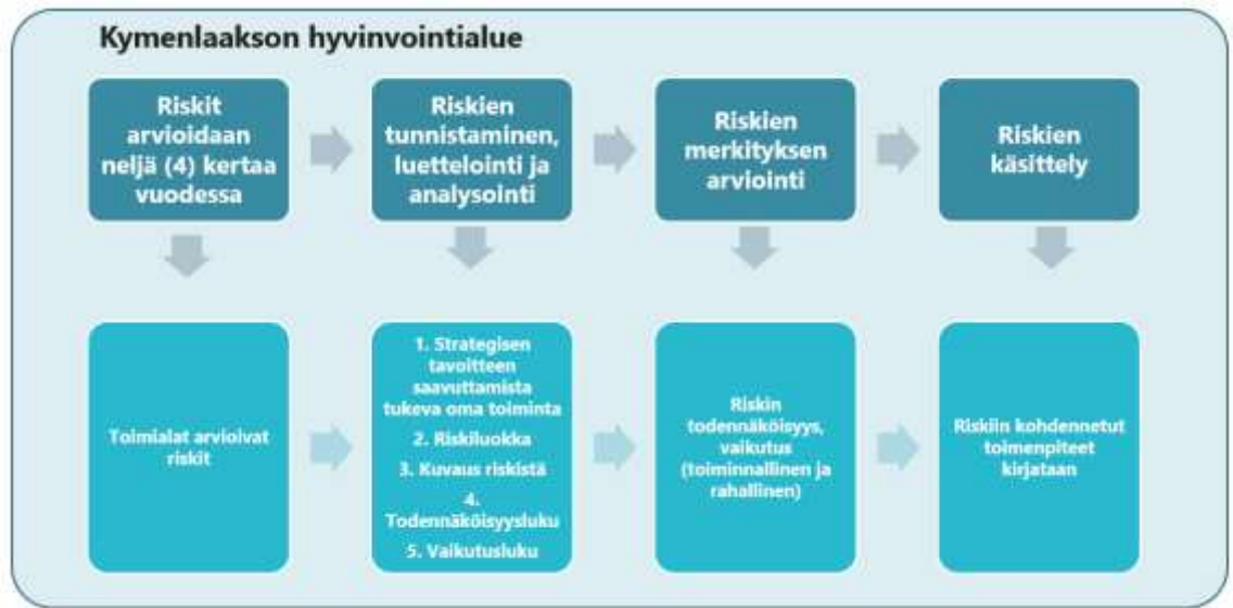
Kuva 1. Riskienarviointiprosessi