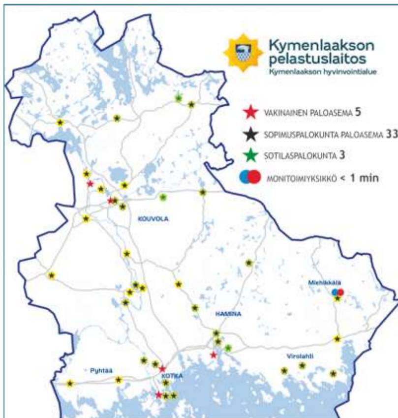
Kuva 3. Pelastuslaitoksen palveluverkosto 1.1.2023

Kymenlaaksossa toimii myös kaksi toimenpidepalkkaista palokuntaa, Miehikkälässä ja Myllykoskella. Toimenpidepalkkaisten palokunnan henkilöstö on pääsääntöisesti sopimuspalokuntakoulutuksen saaneita henkilöitä. Toimenpidepalkkaisessa palokunnassa työntekijöillä on henkilökohtainen työsopimus pelastuslaitoksen kanssa.